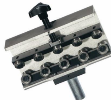
Référence : V900000