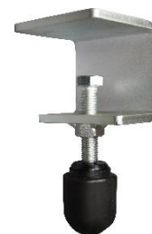
Référence : V900000T