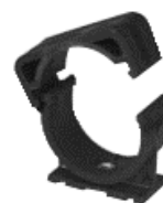
Réf. HCKC25/7N à HCKC50/7N